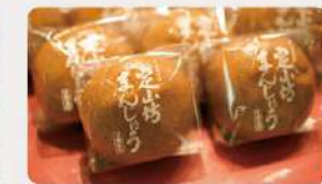
定山坊まんじゅう