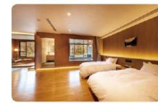
温泉展望風呂付洋室