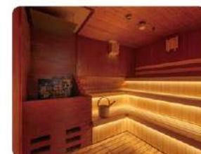
セルフrouリュサウナ

北海道を代表する名湯にふさわしく、男湯・女湯ともに贅沢なまでの広さとゆとりを確保しました。露天風呂は庭園風の情緒あふれる造り。何度でも足を運びたくなる寛ぎの空間です。