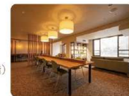
コワーキングスペース