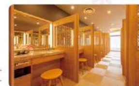
パウダー コーナー