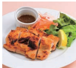
知床鶏の炙り焼 1,100円