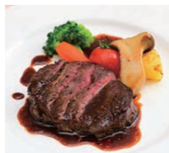
牛ヒレステーキ粒マスタードソース 1,500円