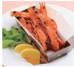
海老唐揚げスパイス風味 1,100円