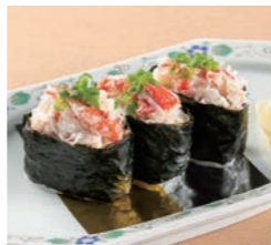
ずわい蟹マヨ軍艦巻 1,100円