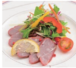
牛スモークサラダ仕立 1,100円