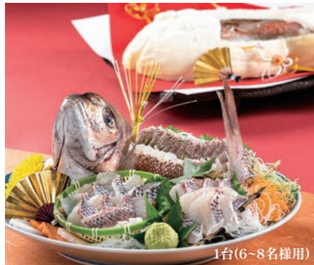
真鯛の姿盛 真鯛の塩釜焼 各7,500円 その他各種ご相談承ります