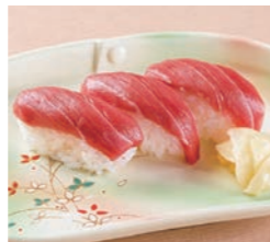
中とろ握り寿司 1,100円