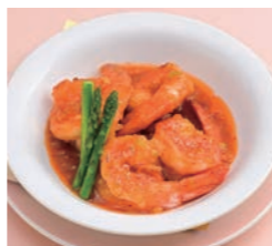
大海老チリソース 1,500円